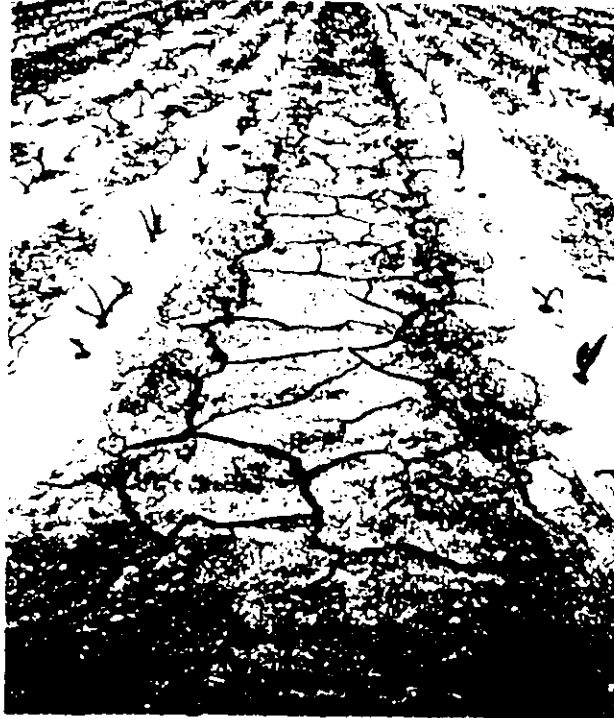
Bodenaustrocknung wegen Übernutzung des Grundwassers in China

Heute geht es allerdings nicht mehr um Auswandern und Ausweichen, denn die weltweite Anbaufläche von eineinhalb Milliarden Hektar ist nicht mehr zu stei-