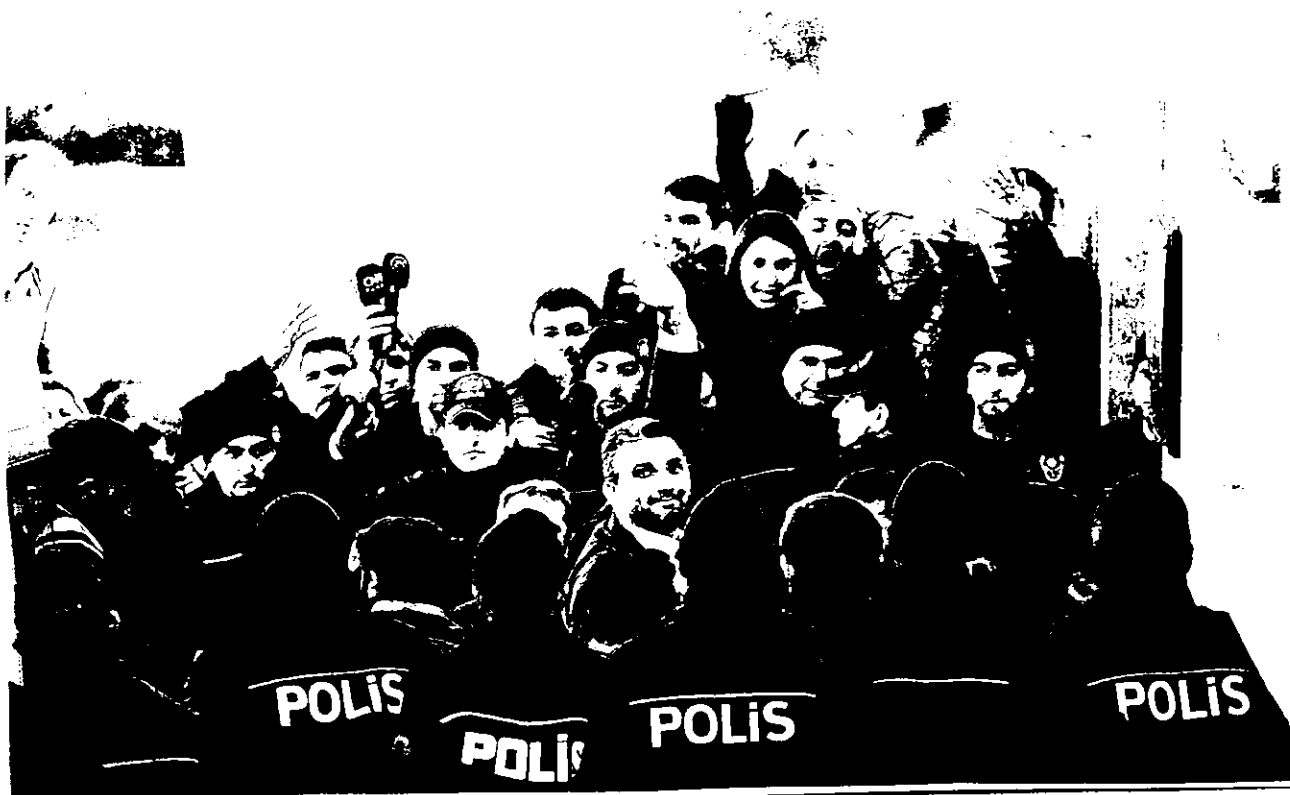
Der Journalist Ahmed Şik , Verfasser des Buches „ Das Heer des Imams “, nach seiner Verhaftung am 5. März vor dem Gericht in Istanbul