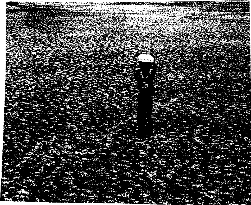
Ausgedörrt: Ein künstlicher See bei Bhopal, seit drei Jahren ohne Wasser.

Wasser zahlen und so den Verbrauch der ärmeren Schichten quersubventionieren. In Indien leben rund 700 Millionen Menschen von weniger als 2 Dollar täglich.