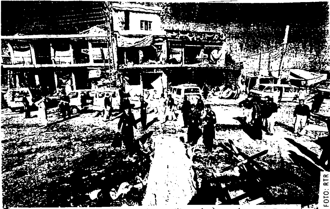
Blutiger Terror: 80 Rekruten einer Militärschule starben am Freitag bei zwei Bombenanschlägen der Taliban in Pakistan.

Das Misstrauen sitzt tief, seit die Amerikaner die Pakistaner bei der Operation in deren eigenem Land