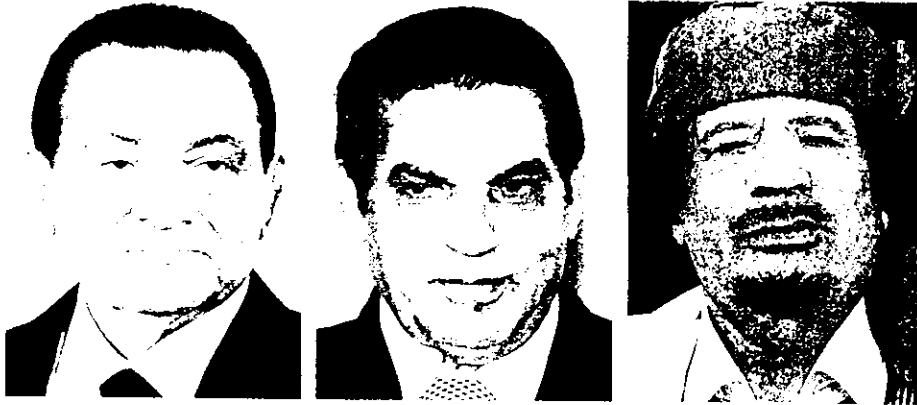
Husni Mubarak, Zine Ben Ali, Muammar Gaddafi,