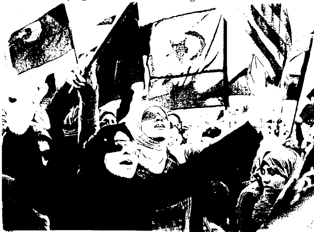
Alle sind Freiheitskämpfer – auch diese Frauen der Oppositionsbewegung, die vor dem Gerichtsgebäude in Benghasi demonstrieren