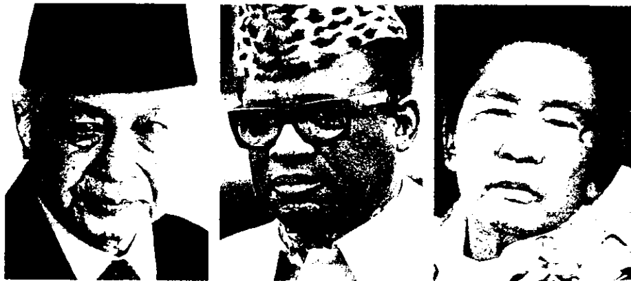
Haji Mohamed Suharto , Mobutu Sese Seko und Ferdinand Marcos

„Die Regierung hat sich für Gaddafi und gegen die Freiheit entschieden“, sagt der Intellektuelle enttäuscht.