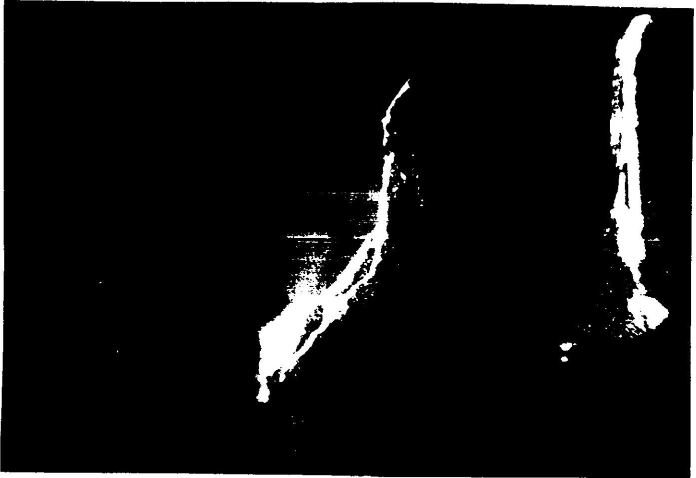
Glühende Lava aus dem Kilauea ergießt sich in den Pazifischen Ozean.

Pinatubo, Philippinen (1981) Schwefeliger Nebel in der Atmosphäre wirkte wie ein globaler Schattenspendler, die Temperatur sank weltweit um 0,6 Grad. Eine Evakuierung nach der exakten Warnung von Vulkanologen rettete viele Menschenleben.